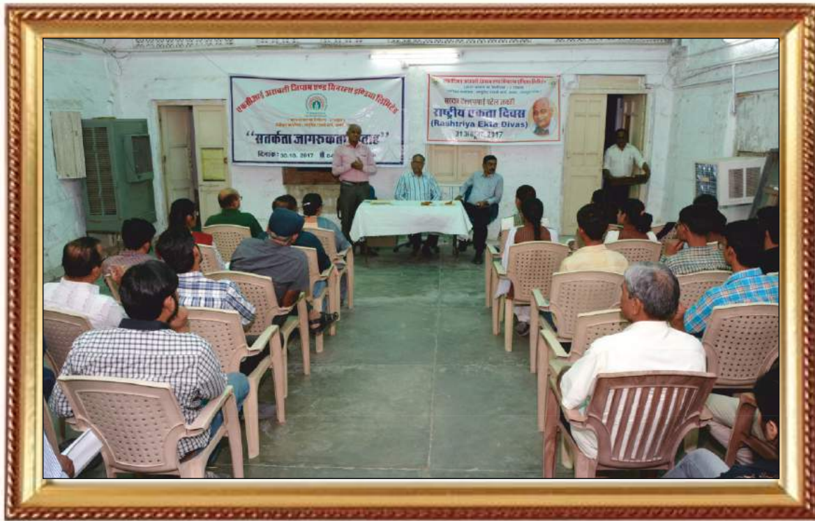
(Celebration of Vigilance Awareness week)

In consonance with the directives of Central Vigilance Commission, "Vigilance Awareness Period -2017" was observed from 31.10.2017 to 05.11.2017 at the Registered Office and all the Area Offices / Mines of the Company.