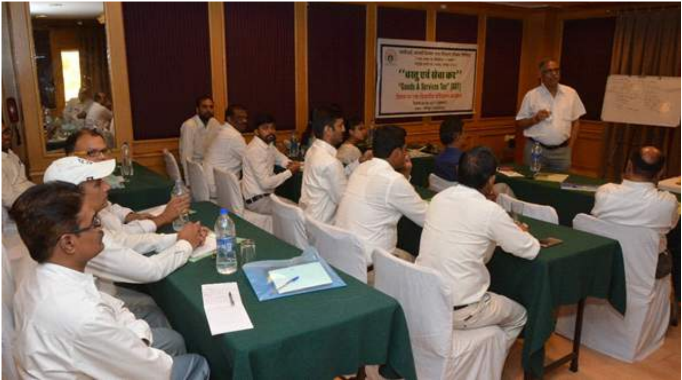
(Workshop being organized by company on GST)

Therefore, to sustain in changing business environment and increase the effectiveness at work, the company provided 78 man-days and 7 man-days training to its executives and non-executives respectively by deputing employees for external and in house training programmes.